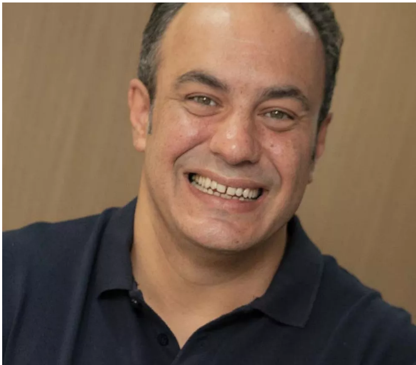
Bernardi, da 3R: universidade comunitária sentiu mais saída de cena do Fies — Foto: Divulgação

19/10/2021 05h01 · Atualizado há 4 horas